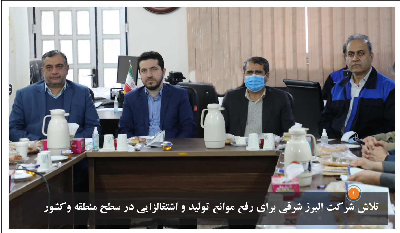
تلاش شرکت البرز شرقی برای رفع موانع تولید و اشتغالزایی در سطح منطقه و کشور